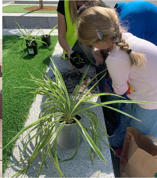
Nye blomster ble plantet og omplantet.