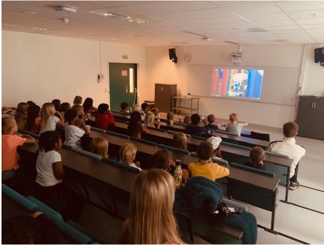
Fredagskino med popcorn og film i auditoriet